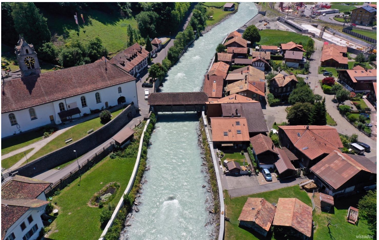
Ufererhöhung Gsteig